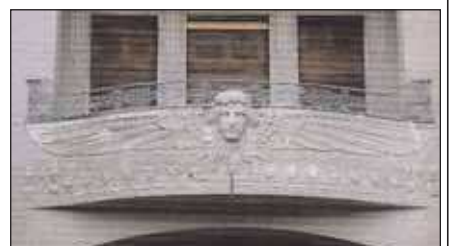
Bild 15 Balkon Helmholtzstr. 5 (6, S. 51)