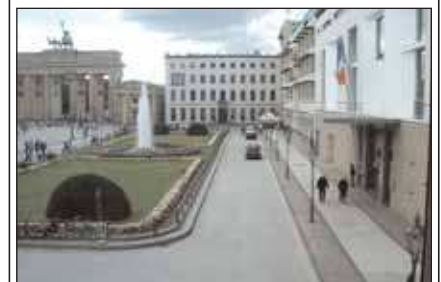
Bild 3 Pariser Platz 2010

Nach dem historischen Vorbild wurde nicht nur das Ensemble der Gebäude gestaltet. Auch die Gestaltung der Freiflächen folgt mit Grünanlagen und Springbrunnen weitgehend der Gestaltung der Vorkriegszeit.