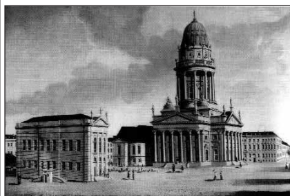
Bild 7, C. T. Fechhelm, Franz. Komödienhaus auf dem Gendarmenmarkt 1788 (7, S.144)

Als dritter im Bunde soll der Gendarmenmarkt, zwischenzeitlich in Platz der Akademie umbenannt, betrachtet werden. Eine Darstellung aus dem Jahre 1788 zeigt den Platz noch mit dem „Französischen Komödienhaus“. Der französische Dom wurde 1701-1705 errichtet. Ende 1699 betrug die Zahl der französischen Zuwanderer 5682, was einem Fünftel der damaligen Berliner Bevölkerung entsprach. (8,S.11)