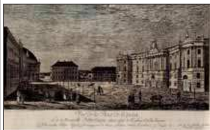
Bild 4, J. G. Rosenberg Ansicht des Opernplatzes mit der neuen Bibliothek 1782 (5, S.42)

1774-88 folgte die Alte Bibliothek von G. Ch. Unger. Zwischen Oper und „Kommode“ lag für die nächsten Jahrhunderte der Opernplatz.