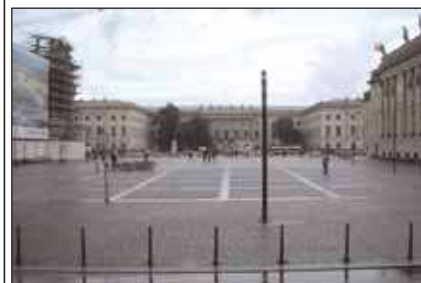
Bild 6 Bebel-Platz 2010

Mit dem Bau des Lindentunnels zwischen 1914 und 1916, zur Verlagerung des Straßenbahnverkehrs, verschwanden die Grünanlagen auf dem Opernplatz. 1935/36 erfolgten noch einmal größere Umgestaltungen von Fassade und Freibereichen der Universität, die seit dem 8. Februar 1949 den Namen Humboldts trägt. Noch heute, nach dem Bau der Tiefgaragen und dem Mahnmal an die Bücherverbrennung, bietet der Platz eine steinreiche aber pflanzenarme Großstadtfläche.