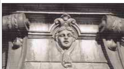
Bild 11 Villa Hirschgarten, Turmdetail (6, S. 79)